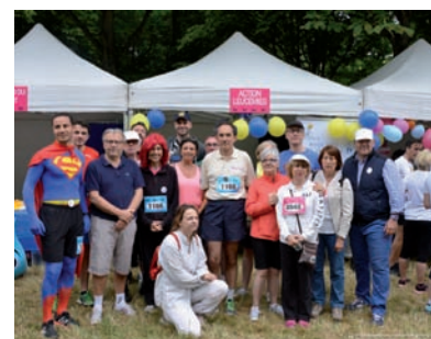
L'équipe de la Course des Héros 2015

Enfin, il y a lieu de citer plusieurs partenariats remarquables : la municipalité d'Épinay-sur-Seine qui reverse tous les ans à l'association une partie de la recette d'un concert, la municipalité de Boulogne-Billancourt qui permet l'organisation de spectacles dans des salles mises à disposition à titre gracieux, l'hôtel Mercure Paris Porte de Saint Cloud qui donne libre accès à ses salles de réunion, et René Oghia Création qui offre une grande partie de ses prestations en communication.