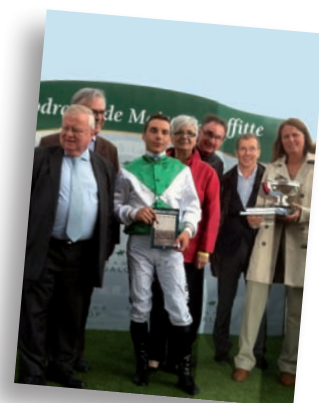
Une course hippique Action Leucémies à Maisons-Laffitte