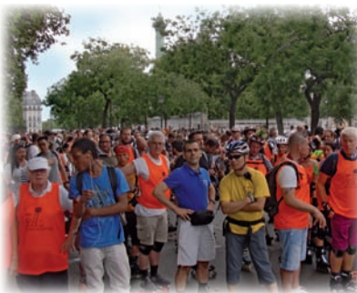
Contre la leucémie tous en roller..!

Action Leucémies s'est investie aux côtés d'autres associations de patients dans des groupes de travail mis en place par Pfizer. Un de ces groupes de travail a traité de l'accompagnement des patients, avec « Pact Onco », Parcours de soins virtuel pour informer les patients atteints d'un cancer et leur entourage, accessible à partir du lien http://pactonco.pfizer.fr . L'autre groupe de travail a abouti à la création par Pfizer, en partenariat avec l'AFSOS (Association Française pour les soins oncologiques de support), d'un site « La Vie Autour » ( www.lavieautour.fr ), carte interactive permettant aux patients, en quelques clics, de repérer les associations de soins oncologiques de support qui existent près de chez eux, et de découvrir leurs activités. Ces deux leaflets sont joints.